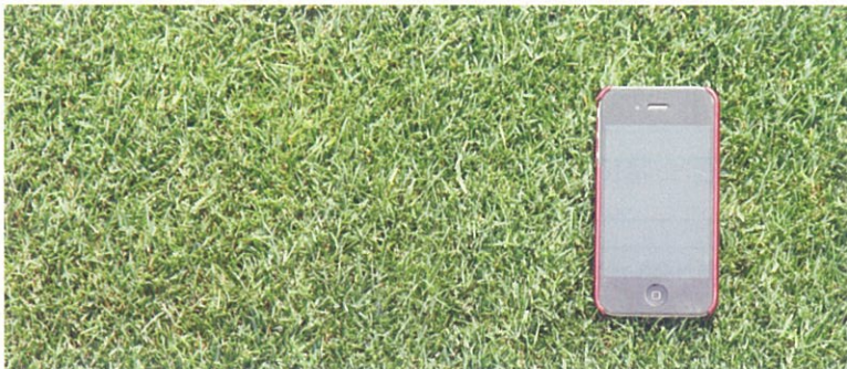
極緻密の高品質ターフをお約束