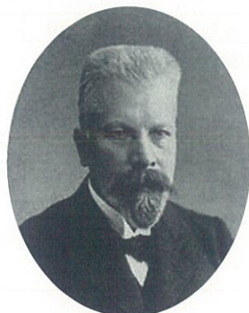
エドゥアルト・ブフナー

全生物の生育維持には、例外なく多種多用の酵素（タンパク質⊕低分子）が関与している。